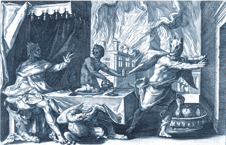
Ликаон, превращенный в волка.

Отношение к оборотням повсеместно граничило с паническим ужасом, хотя в ряде мест их, несомненно, не только боялись, но и уважали. Это больше касалось Северной