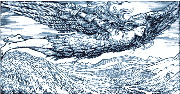
Полет Локи в Етунхейм. У. Г. Коллингвуд, 1908 г.

Однако в мифах эта мечта отражалась специфически, и превращение если и происходило, то редко было человеку во благо. В большинстве случаев он менял облик не по своему желанию, а по произволу какой-то сверхъестественной сущности: бога, демона или сильного колдуна. Причем согласия человека на это не требовалось. Так, колдунья Цирцея (Кирка) превратила в свиней спутников Одиссея; Ио была превращена в корову Зевсом, который хотел спасти любовницу от преследований жены. Правда, не слишком успешно. Афина из зависти превратила искусную ткачиху Арахну в паучиху. А первым волком-оборотнем, согласно