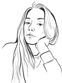
Иллюстрация на обложке и художественное оформление Анастасии Зининой