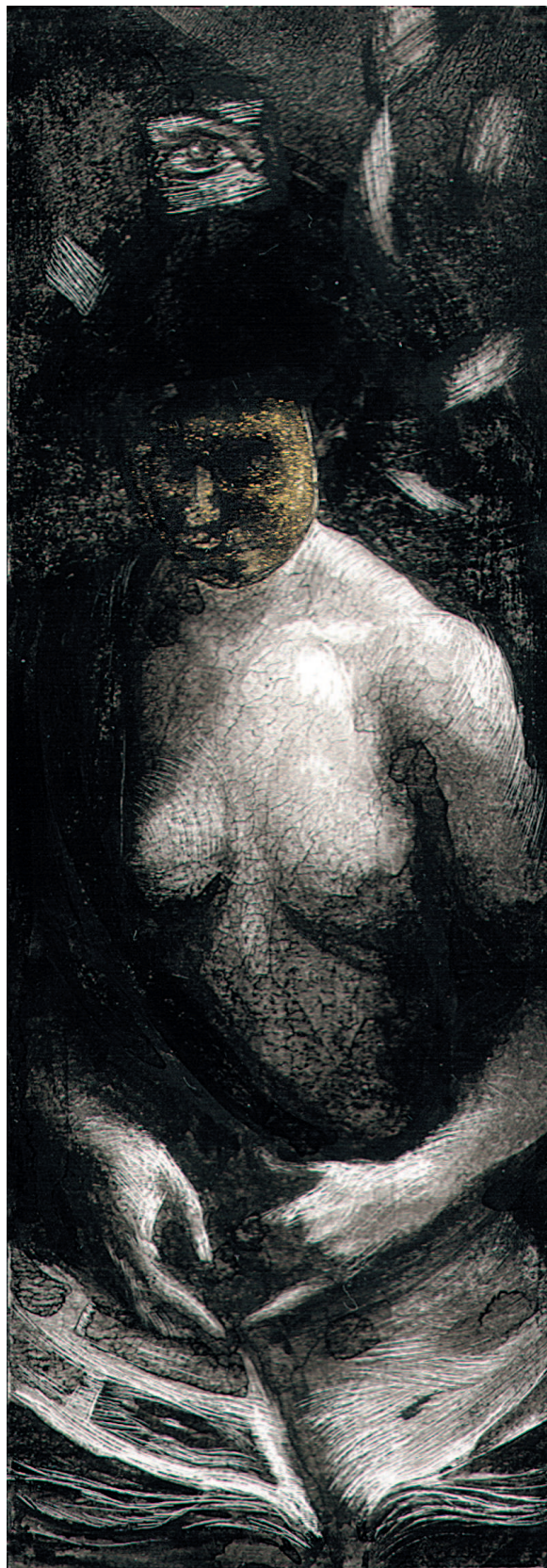
КОЛЛЕКЦИОНЕР Сграффито, 4×12 см, 2005