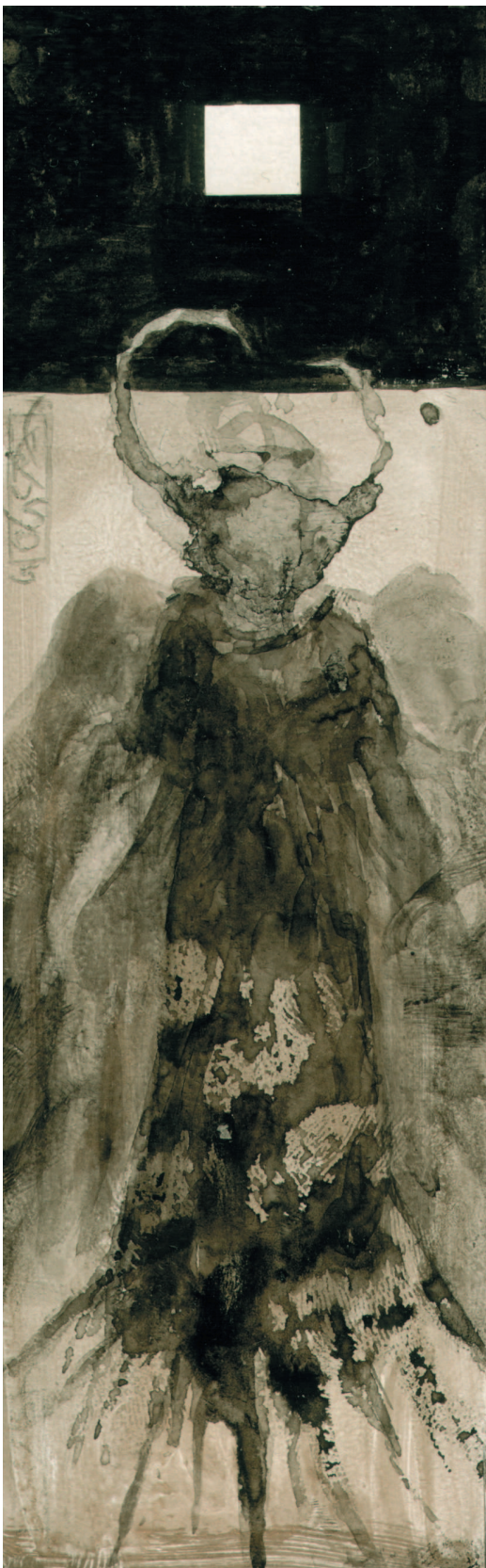
DAEMON Сграффито, 5×14 см, 2005