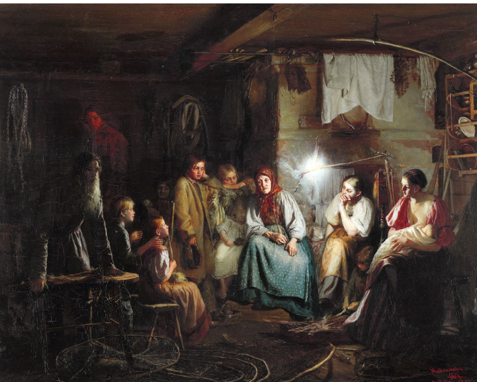
Бабушкины сказки. Картина Василия Максимова. 1867 г.

для обозначения нечистой силы нередко используют одни и те же слова: и в сказке, и в быличке есть чёрт, иногда — леший, Баба Яга часто зовется колдуньей или ведьмой. Однако при всем внешнем сходстве это два принципиально разных жанра. Во-первых, былички невелики по объему — волшебные сказки, как правило, значительно длиннее. Во-вторых, как уже говорилось, события быличек в целом воспринимаются как вполне правдивые, случились они недавно и в знакомых рассказчику и слушателям местах — в то время как события