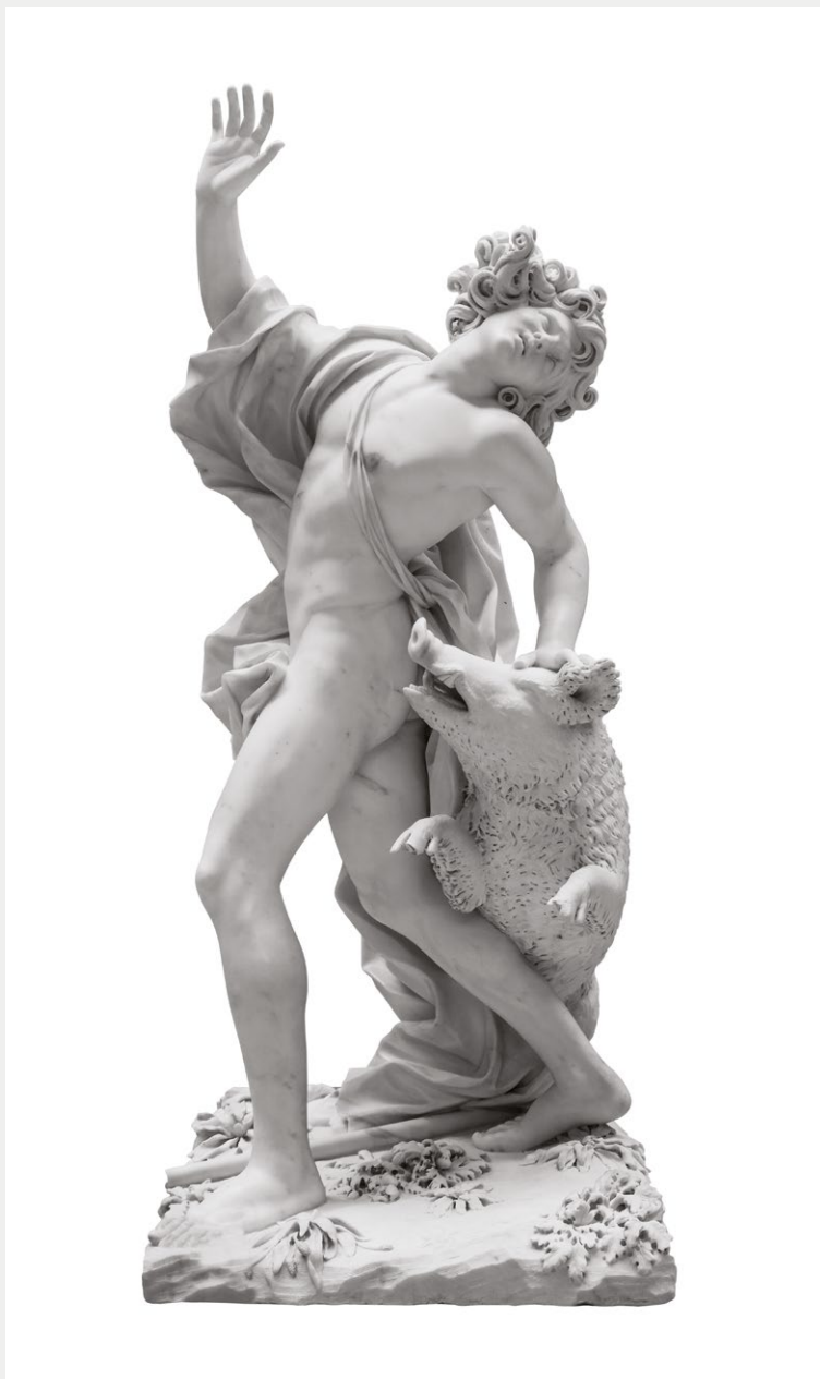
Гибель Адониса Джузеппе Маццуола. 1700–1710 гг.