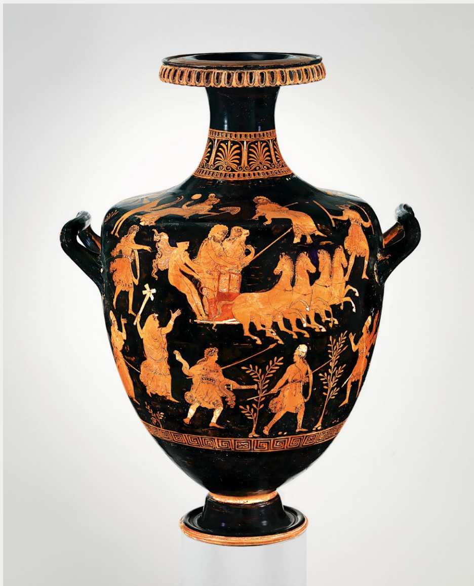
Похищение Персефоны Апулийский краснофигурный спиральный кратер, около 340 г. до н. э.

Почитать описание, рецензии и купить на сайте МИФа