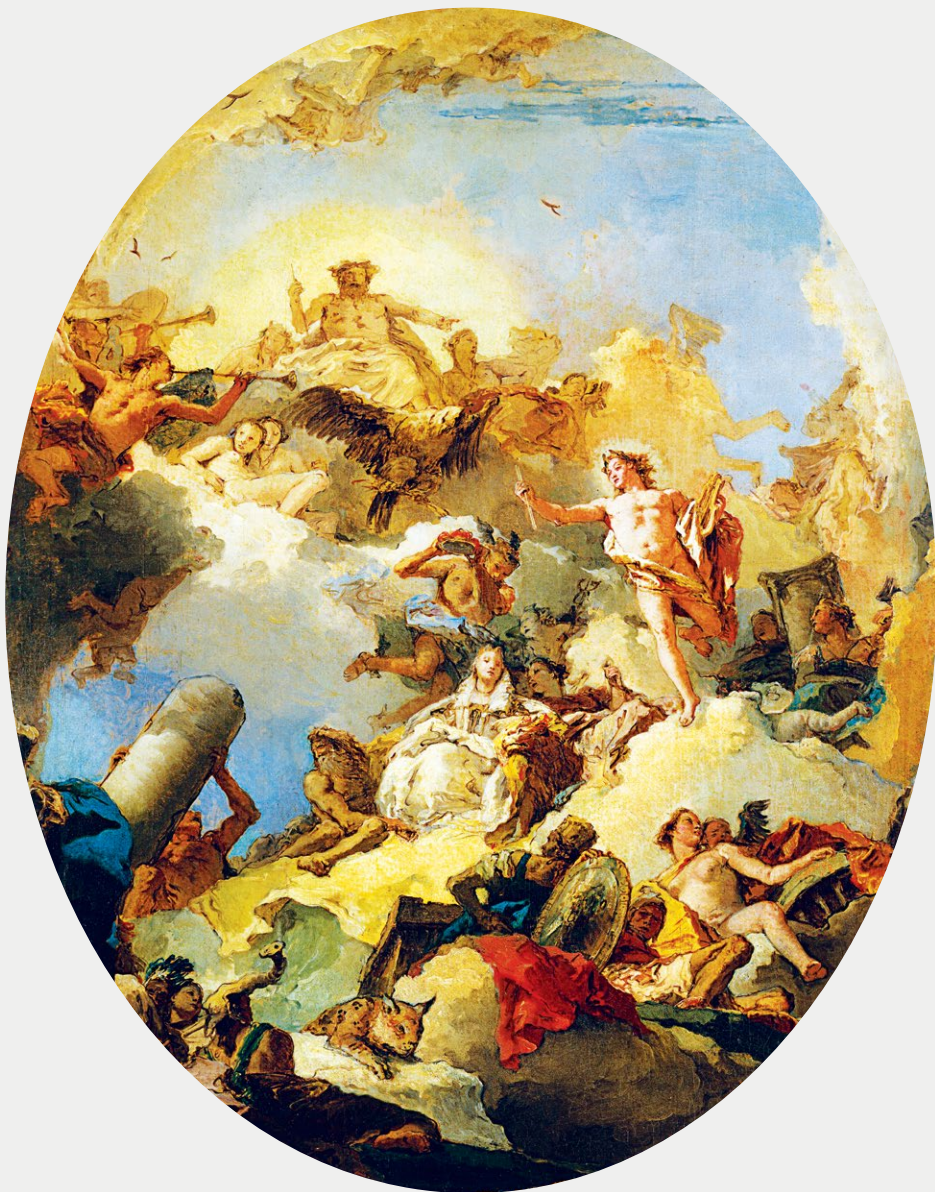
Боги на горе Олимп Джованни Баттиста Тьеполо. Эскиз для Королевского дворца в Мадриде

Почитать описание, рецензии и купить на сайте МИФА