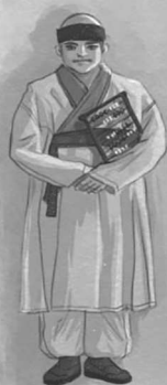
ПРИЗРАК АН ХЮНСУ