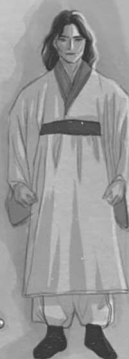
ПРИЗРАК ДЖИ ПЭУН