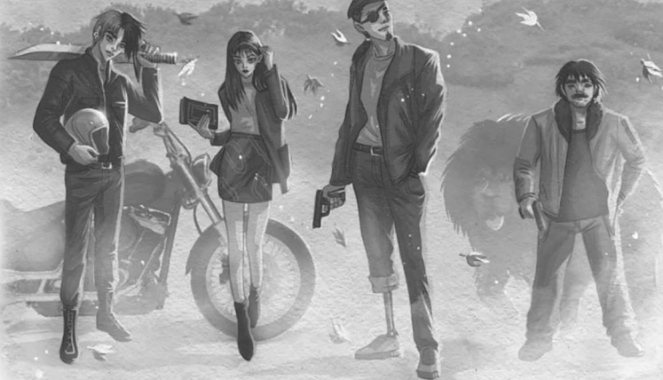
ДОН ЮЛЬ СТАРШИЙ ИНСПЕКТОР