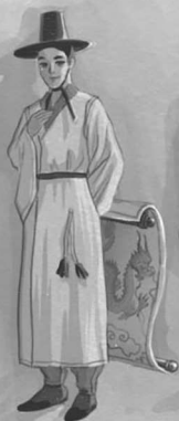
ПРИЗРАК СИН ЧАНЕЛЬ