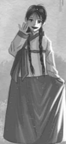
МОККВИСИН ДУХ СОСНЫ