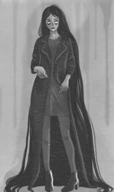
ИНП СИМ ЛИА