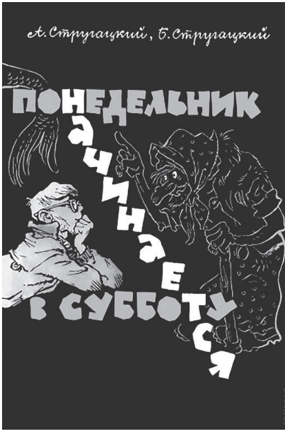
Обложка первого издания. 1965 г.

Для братьев Стругацких это в самом деле было счастливое время — от публикации первых повестей и рассказов они перешли к написанию и выпуску отдельных книг, которые без особого труда добирались до типографии и находили свой путь к восторженному читателю, не избалованному настоящей современной литературой.