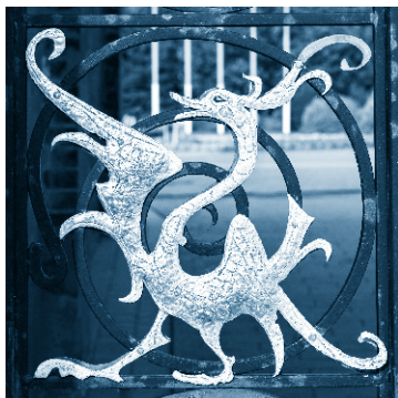
Позолоченный барельеф на воротах Казанского кремля

люди, и нижнего — подземного, куда уходят души умерших. Все три яруса закреплены вокруг Мировой оси, которая может представляться в виде Мировой горы или Мирового дерева.