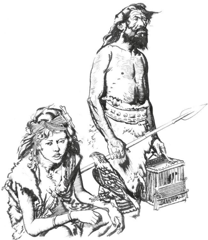
Иллюстрации Зденека Буриана