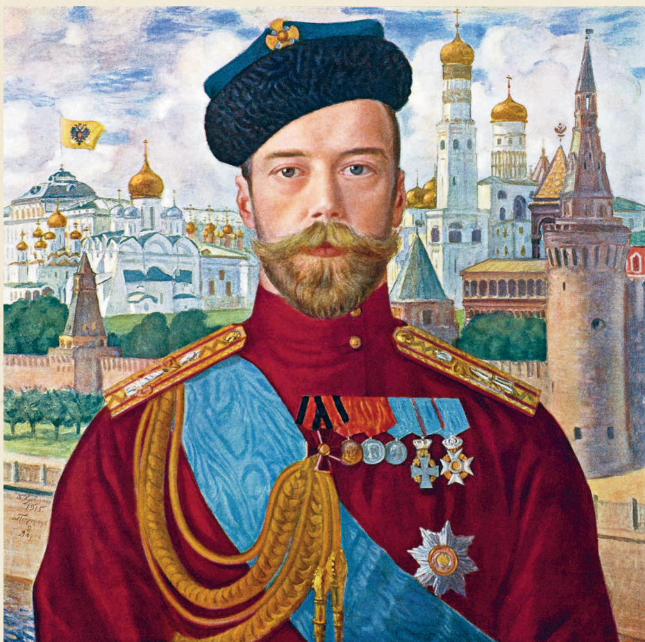
Николай II. Б. Кустодиев

в одиночку не смог бы им управлять. Нагрузка самодержца была совершенно невозможной. Времена, когда претенденты брали престол с боем и затевали перевороты, остались в далеком прошлом. Последним царем, рвавшимся к власти, был Павел. Уже его сын Александр мечтал о том, чтобы отказаться от престола и жить частной жизнью. Все последующие государи, даже динамичный Николай I, считали корону тяжким бременем и, если б существовал выбор, с радостью от нее отказались бы.