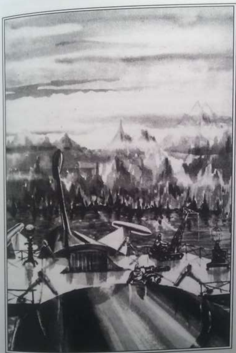
Строительство на берегу небольшой пристани.