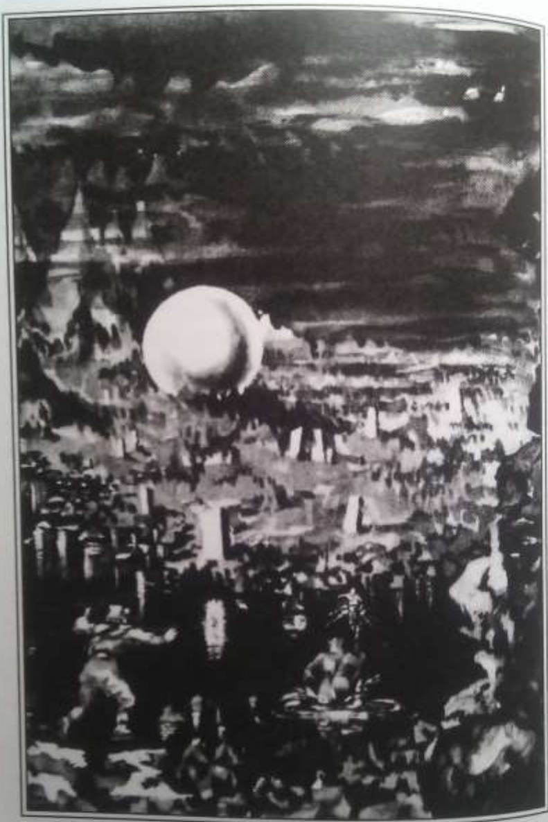
Арсеньев первым достиг залива и, не колеблясь, вошел в воду.