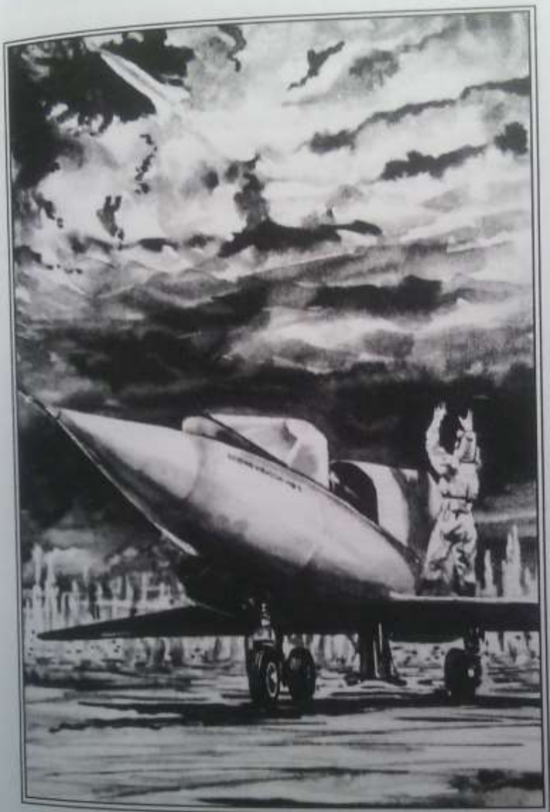
Перскинув ноги через борт, пилот поднялся на крыло.