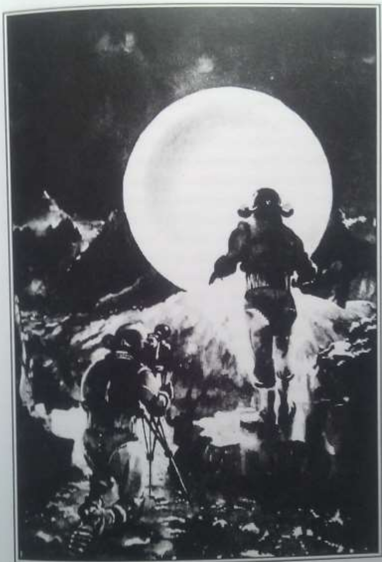
Среди крутых обрывов стоял Белый Шар.