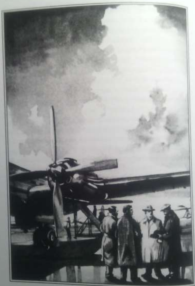
Рассматривая загадочный камень, ученые взяли его с собой.