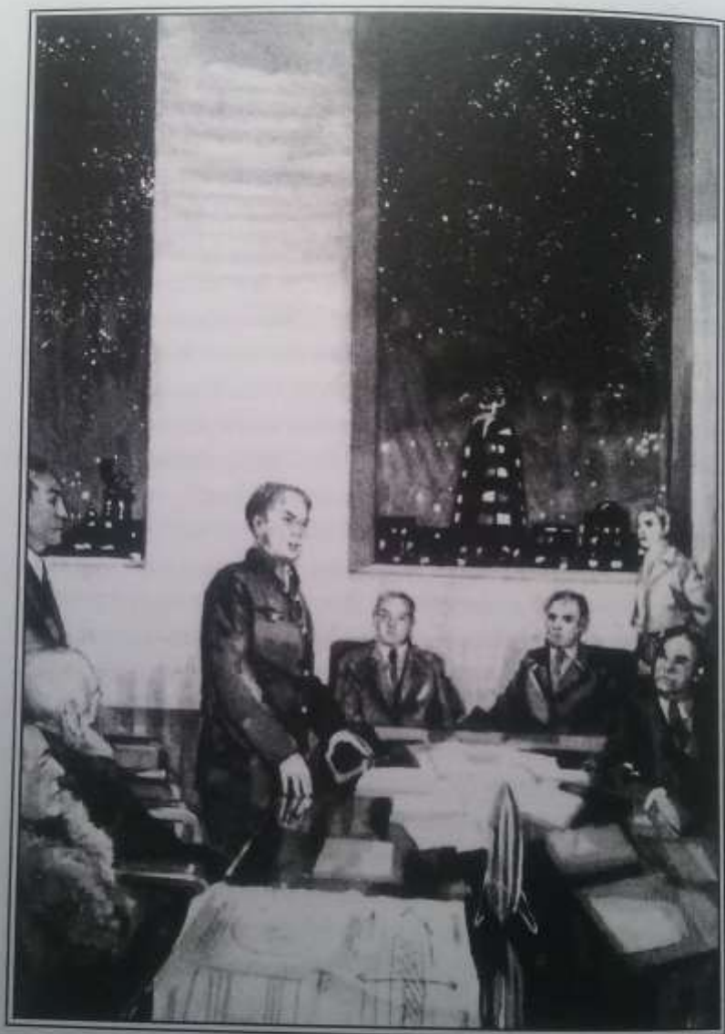
Заседание Комитета народностей в здании Наркомнацдел.