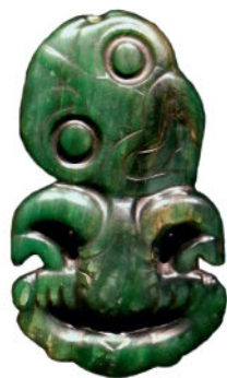
Амулет из нефрита. Новая Зеландия. Маори. XVI–XVIII вв.

Магический обряд завершен, дровосеки принимаются за работу. До появления механических