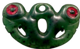
Серьга из нефрита. Новая Зеландия. Маори. XIX в.