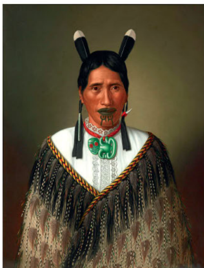
Готфрид Линдауэр. Портрет женщины маори. 1885

узнаем, с большей или меньшей достоверностью, о самых первых приключениях людей на Тихом океане — о сказочной встрече бальзовых плотов, приплывших из Америки, и пирога, приплывших с запада и снабженных уже, быть может, своими удивительными балансирами. А пока расскажем о первом документально подтвержденном великом событии в истории Тихого океана — о встрече жителей Океании с европейцами, приплывшими к ним наиболее длинным путем.