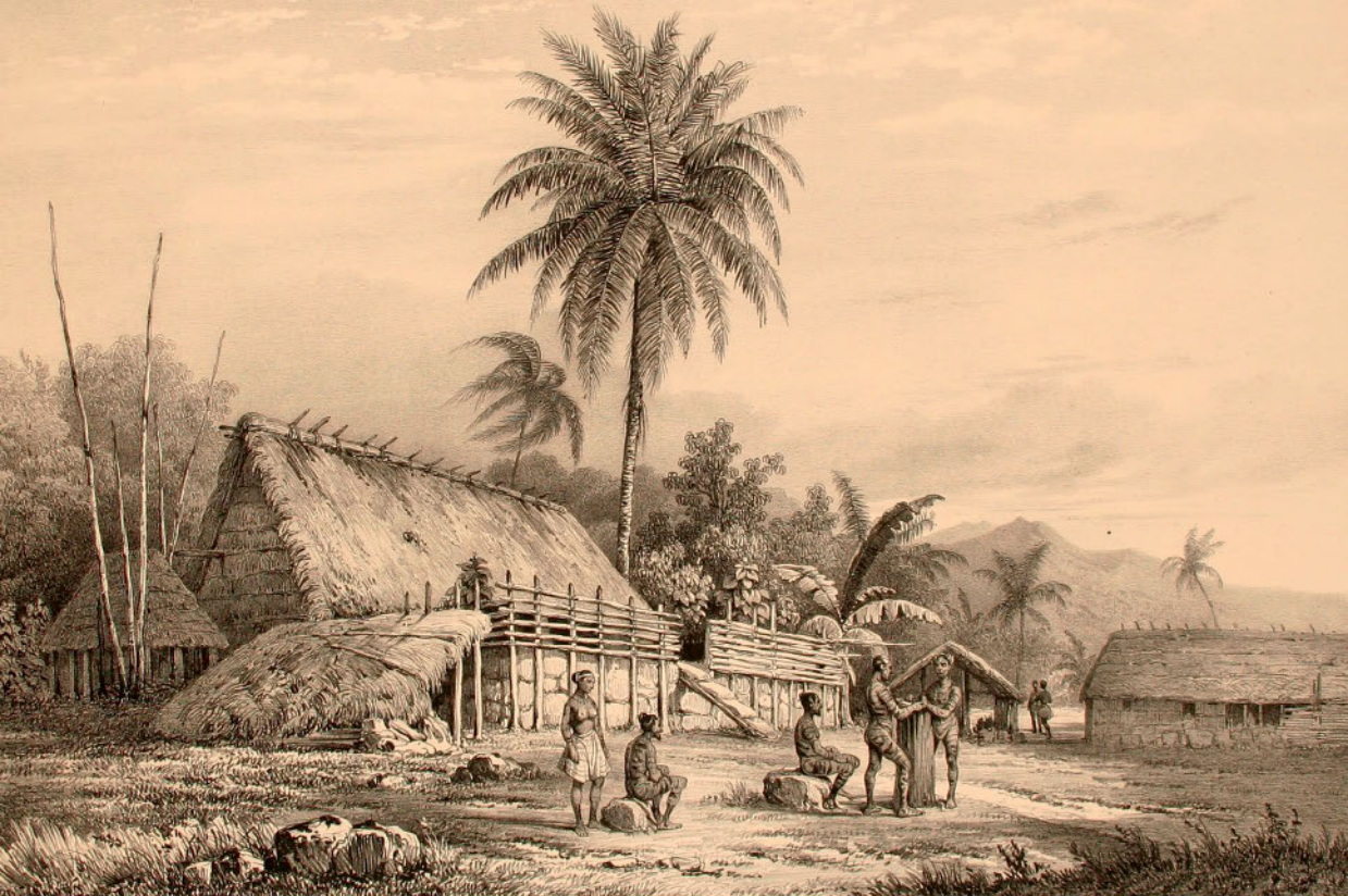
Луи Ле Бретон. Вид поселения в Полинезии. 1846

магических ритуалов. Никто никуда не торопится. Изготовление пироги — это не просто полезное дело. Это церемониал. Пирог для ее владельца — кормилица, залог выживания, и относится он к ней почти так же, как ребенок к отцу и матери.