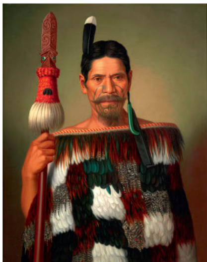
Готфрид Линдауэр. Портрет воина народности маори в плаще из птичьих перьев. 1885