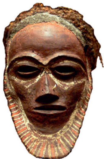
Маска из человеческого черепа. Папуа—Новая Гвинея. XIX в.

пил способов срубить дерево было не много: сначала делали глубокую зарубку у корня с той стороны, куда надлежало свалить дерево, потом начинали его пилить с противоположной стороны. Но наши микронезийские дровосеки XVI века работают совсем не так, как рабы или рабочие на конвейере. Они без умолку разговаривают, иногда поют. Время от времени они прерывают работу, усаживаются неподалеку, возвращаются, а потом, в середине дня, когда наступают самые жаркие часы, уходят в деревню: пришло время искупаться в море, поесть и отдохнуть. Вернутся ли они, чтобы завершить работу до конца дня, неизвестно. Быть может, придут сюда только на следующий день. Рубка дерева для изготовления пи-