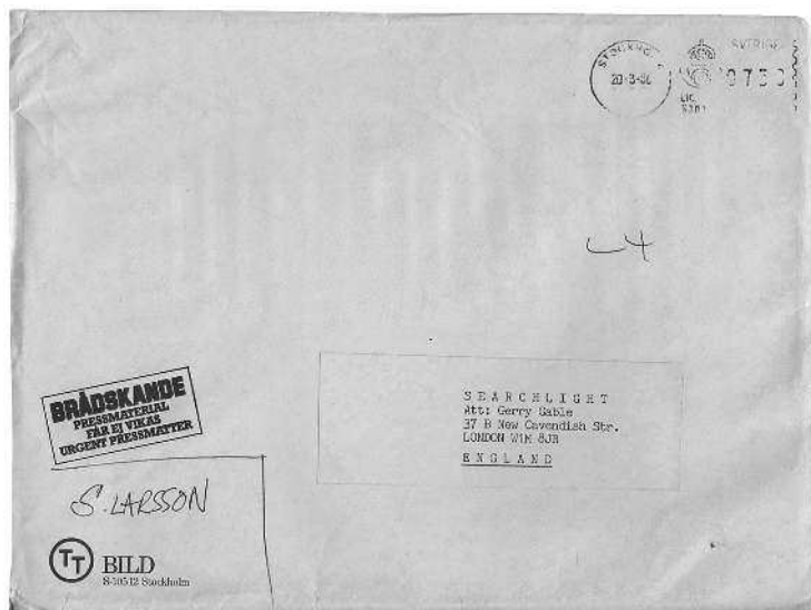
Письмо Стига Ларссона, написанное по-английски Джерри Гейблу 20 марта 1986 года

Думаю, через год-другой новой истиной станет то, что убийство Пальме раскрыто.