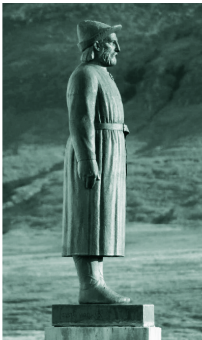
Памятник Снорри Стурлусону, исландскому ученому, политику и поэту XIII века, возле его дома в Рейкхольте

обманут: в первый раз — богиней Гевьон (глава 1), а во второй раз слишком поздно понял, что его одурачили и лишили возможности попасть в Асгард, где жили сами асы. Гюльви решил разузнать больше об этих обманщиках; его допустили в тронный зал, где он встретил троих. Они назвали себя Высокий, Равновысокий и Третий*.