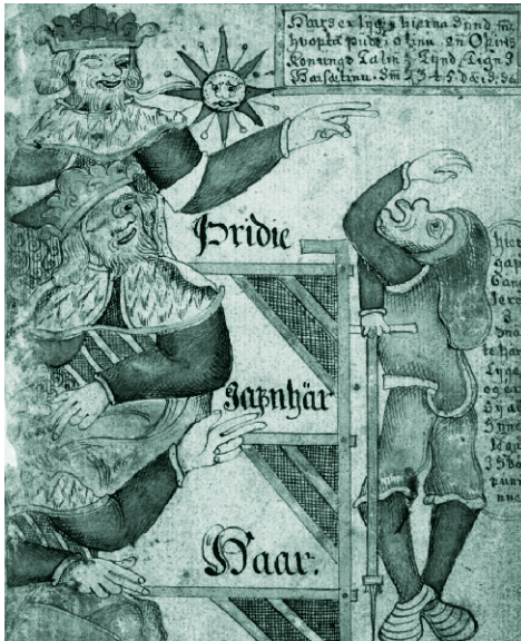
Король Гюльви встречает Высокого, Равновысокого и Третьего. Миниатюра исландской рукописи XVIII века

мира и человеческого рода, о конце мира — его называют Рагнарёк, — когда боги и великаны будут сражаться друг с другом, и о том, как земля обновится и возродится. Высокий и его спутники советуют как можно эффективнее воспользоваться полученными знаниями, после чего величественный тронный зал и вся крепость исчезают. Гюльви возвращается домой, чтобы поделиться услышанным с людьми.