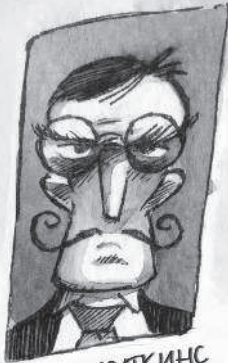
ОРСОН ЖУТКИНС 1871 - ?