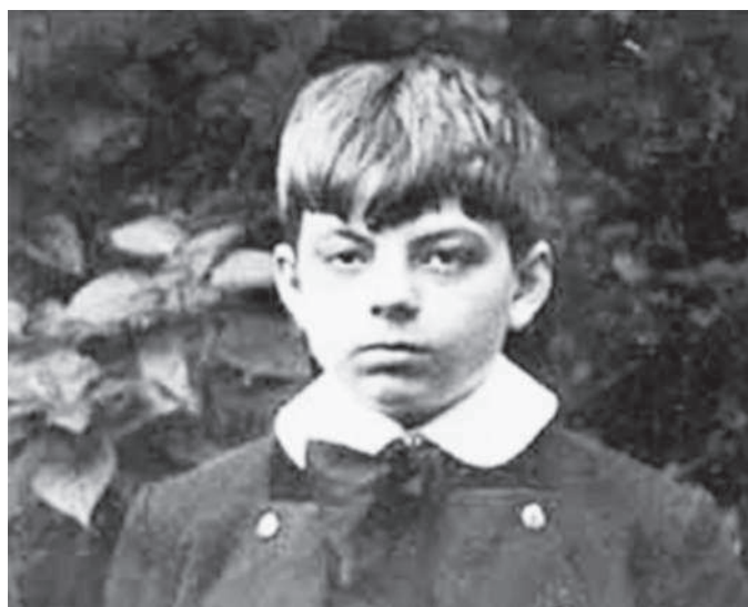
Антуан де Сент-Экзюпери в детстве

Родился Антуан Мари Жан-Батист Роже де Сент-Экзюпери в Лионе в 1900 году. Он был третьим из пяти детей. Семья принадлежала к старинному дворянскому роду, впрочем, отец работал простым страховым инспектором. Он рано умер, и мальчик жил то у своей двоюродной бабушки — виконтессы Трико, то у родителей матери. С 1908 года Тонио (так звали его в семье) учился в престижных католических школах, иезуитских колледжах, с октября 1919 года был вольнослушателем Национальной высшей школы изящных искусств.