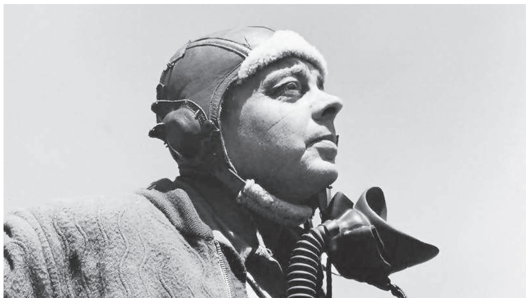
Антуан де Сент-Экзюпери