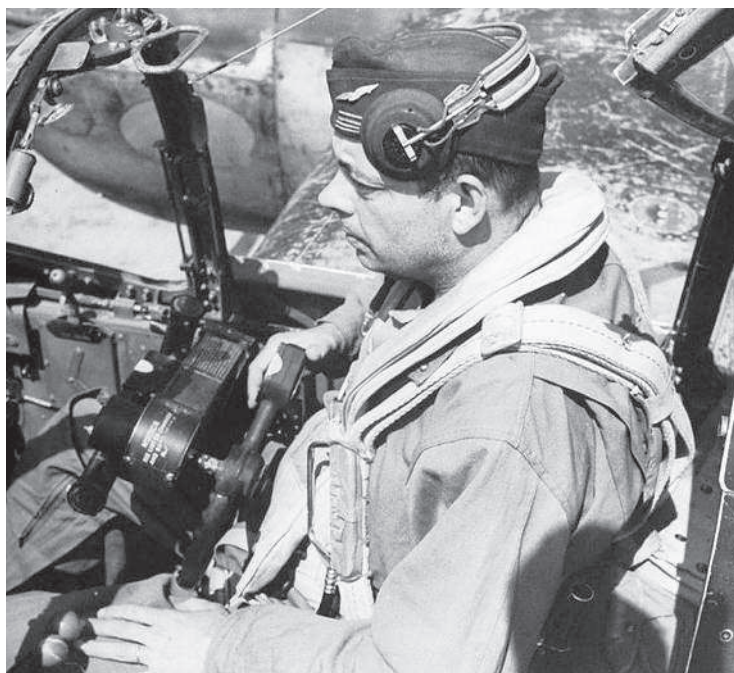
Антуан де Сент-Экзюпери в кабине Р-38 «Лайтнинг»

пилотирование нового скоростного самолета Р-38 «Лайтнинг».