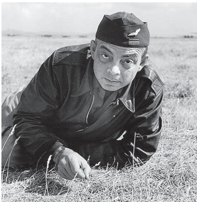
Антуан де Сент-Экзюпери. Сардиния. 1944 год

31 июля 1944 года Антуан де Сент-Экзюпери отправился с аэродрома на Корсике в разведывательный полет и не вернулся. Долгое время о его гибели ничего не было известно, и думали,