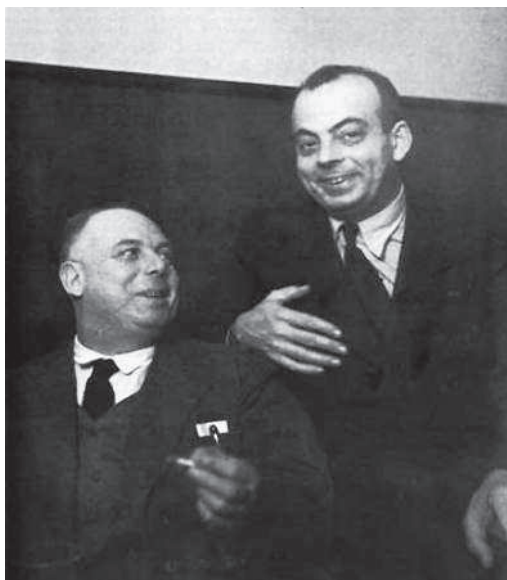
Жан Ренуар и Антуан де Сент-Экзюпери. 1944 год

тридцать лет, лишь два источника: экономическая система XIX века, зашедшая в тупик, и духовное отчаяние... Отчего Россия? Отчего Испания? <...> У нас одна задача, одна-единственная — вновь открыть, что существует духовная жизнь, она выше, чем жизнь разума, и только она может утолить жажду», — значит в одном из последних его писем, написанных в 1944 году. Помимо Испании и России, Сент-Экзюпери работал в Аргентине, которой в общем-то и посвящен «Ночной полет». Там же он писал статьи, которые впоследствии расхватавали самые престижные мировые газеты и журналы. Летал Сент-Экзюпери все время. Летал без всякого страха, сам, как было принято в то время. Сам заводил мотор, сам придумывал