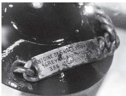
Браслет Антуана де Сент-Экзюпери

что он разбился в Альпах. И лишь в 1998 году в море недалеко от Марселя обнаружили браслет, на котором было несколько надписей: «Antoine», «Consuelo» (имя жены летчика) и «c/o Reynal & Hitchcock, 386, 4th Ave. NYC USA». Это был адрес издательства, в котором выходили книги Сент-Экзюпери.