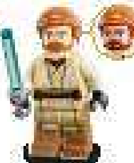
2013 г. Набор 73012 ККБР-спидер с коляской