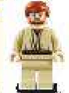
2007 г. Набор 7461 Джедайский истребитель с гиперпространственным кольцом-ускорителем