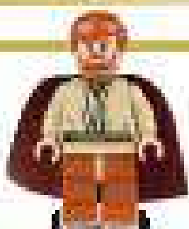
2005 г. Набор 7155 Преследование генерала Гривуса