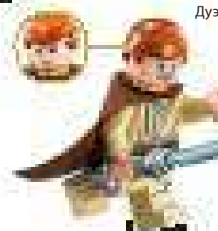
2014, 2015 гг. Наборы 75058 МТТ и 75092 Истребитель Набу