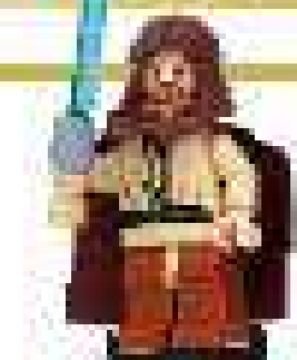
2007 г. Набор 7257 Последняя дуэль на световых мечах