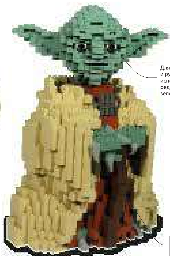
2002 г. Набор 7194 Йода