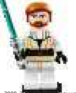
2008–2012 гг. (информацию о наборах см. на с. 319)