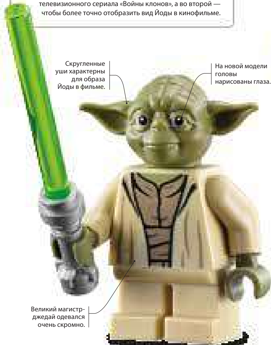
2013, 2016, 2017 гг. Наборы 75017 Дуэль на Джеонозисе, 75142 Самонаводящийся дroid-паук, 75168 Звездный истребитель Йоды

Глава Ордена джедаев, Йода выживает после активации Приказа 66 и наставляет Люка Скайуокера на путях Силы. Первая мини-фигурка Йоды стала первой фигуркой из всех, выпущенных LEGO®, в которой были использованы короткие негибачиющиеся ноги. Помимо нового рисунка голова Йоды дважды меняла форму: в первый раз для лучшего соответствия стилистике телевизионного сериала «Войны клонов», а во второй — чтобы более точно отобразить вид Йоды в кинофильме.