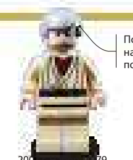
2009 г. Набор 4179 Коллекционный набор «Сокол Тысячелетия»