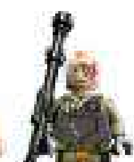
2013 г. Набор 75024 Стархopper NH-87