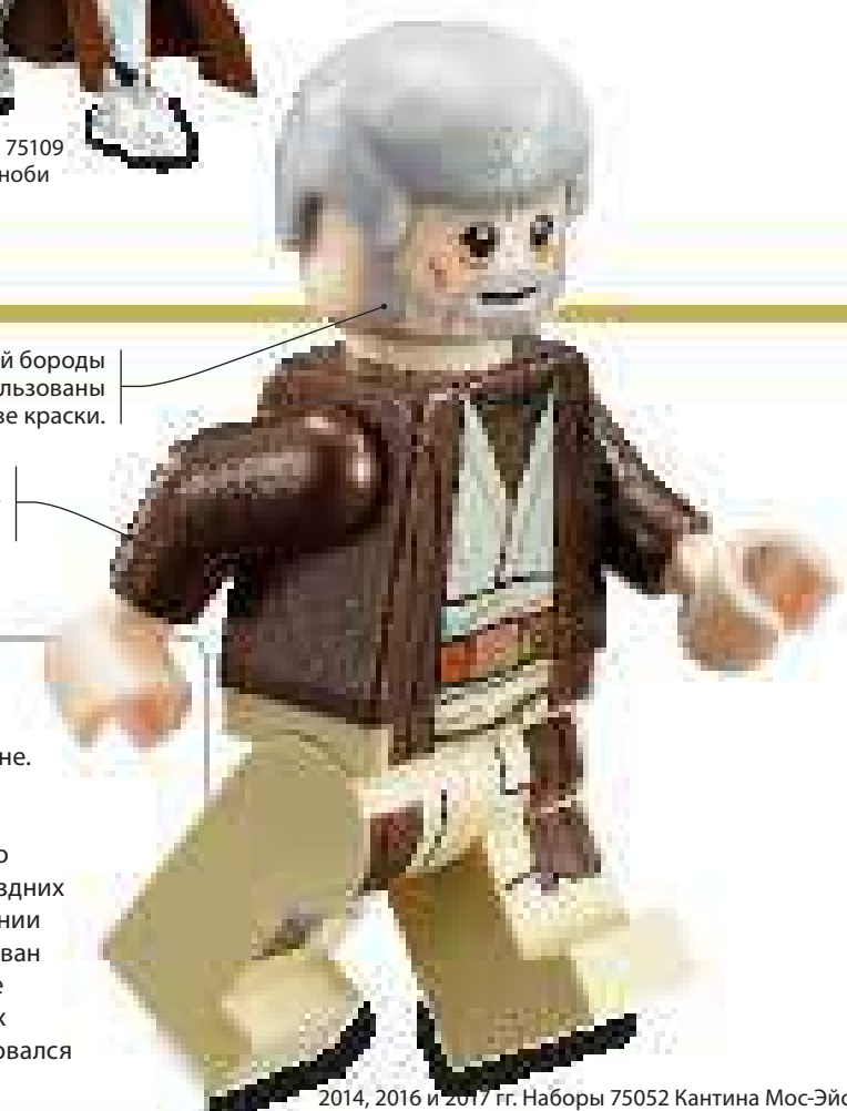
2014, 2016 и 2017 гг. Наборы 75052 Кантина Мос-Эйсли, 75159 Звезда Смерти, 75173 Лэндспидер Люка

В эпоху Империи Оби-Ван живет в изгнании на Татуине. Здесь он становится наставником юного Люка Скайуокера и знакомит его с путями Силы. У более поздних фигурок Оби-Вана в изгнании джедайский наряд нарисован непосредственно на торсе и руках, тогда как в ранних версиях фигурок использовался коричневый плащ.