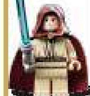
2007 г. Набор 7665 Республиканский крейсер