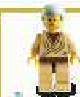
1999 г. Набор 7110 Лэндспидер