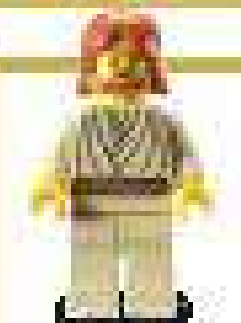
2004 г. Набор 7133 Преследование охотника за головами, 7143 Джедайский истребитель