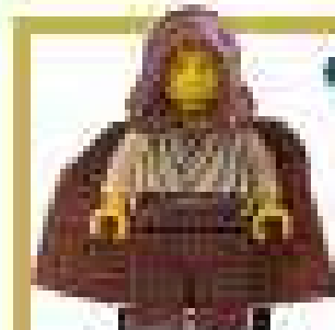
1999 г. Набор 7161 Гунганская подводная лодка

Оби-Ван Кеноби, юный падаван магистра-джедая Квай-Гона Джинна отличается талантом и горячностью. Для короткой стрижки Оби-Вана использованы классические волосы LEGO, одета фигурка в бежевый костюм джедая. У большинства мини-фигурок Оби-Вана косичка падавана нарисована на торсе.