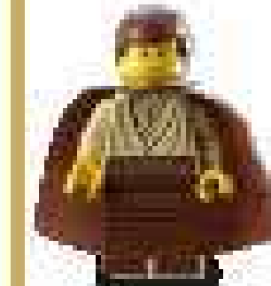
2002 г. Набор 7203 Защита джедаев I