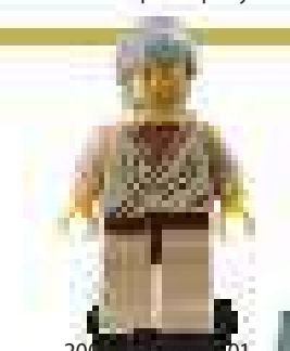
2004 г. Набор 4301 Кантина Мос-Эйсли