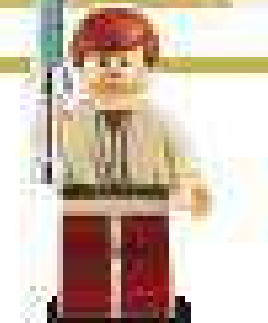
2007 г. Набор 4283 Последняя космическая битва