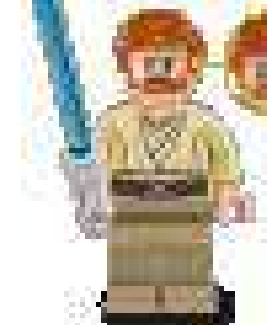
2012 г. Набор 9494 Джедайский перехватчик Энакина