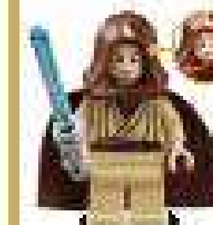
2011 г. Набор 7962 Ночные поды Энакина Скайуокера и Себульбы