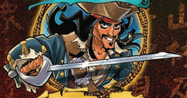
Капитан Джек Воробей

Остроумный и непредсказуемый, он был капитаном «Чёрной Жемчужины», но терял и находил этот корабль слишком часто.