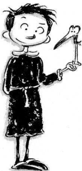
Сэм Баттербитгинс- младший и Птенчик Денди