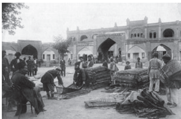
Сортировка ковров. Грузия, 1870—1890 гг.