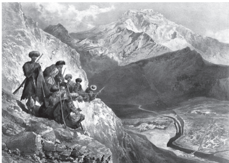
Г. Гагарин. Селение Голотль в плоской пойме реки Аварское Койсу