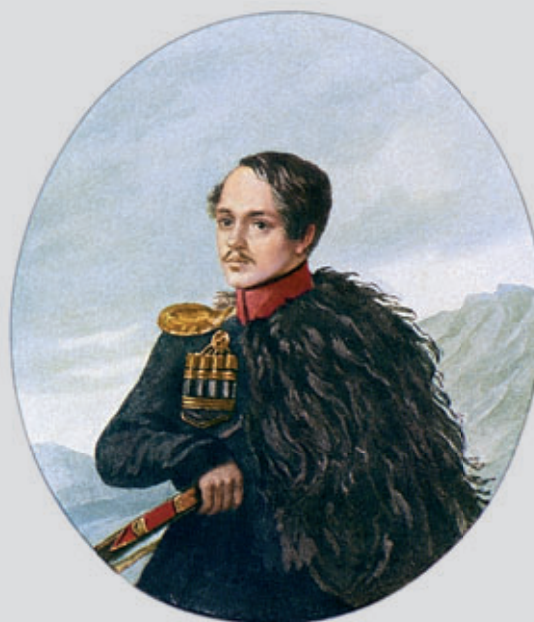
М. Ю. Лермонтов. Автопортрет, 1837 г.

Сначала немного истории. Земли Грузии, расположенные в Закавказье, граничили с многими народами, по ее территории постоянно прокатывались волны захватчиков — римляне, турки, арабы, византийцы, монголы, персы, чеченцы, черкесы и прочие с завидной регулярностью разоряли города и селения. Многие считали, что страна навеки будет поделена между Турцией и Персией. Боеспособное население страны просто не успевало восполняться, казалось, что после очередного нашествия эта земля сожжена навеки, но ее буквально на руках поднимали из руин.