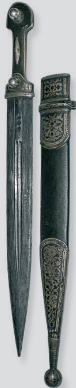
Кинжал тифлиссский, XIX век