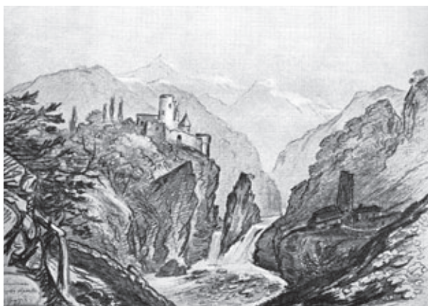
М. Ю. Лермонтов. Развалины на берегу Арагвы, 1837 г.