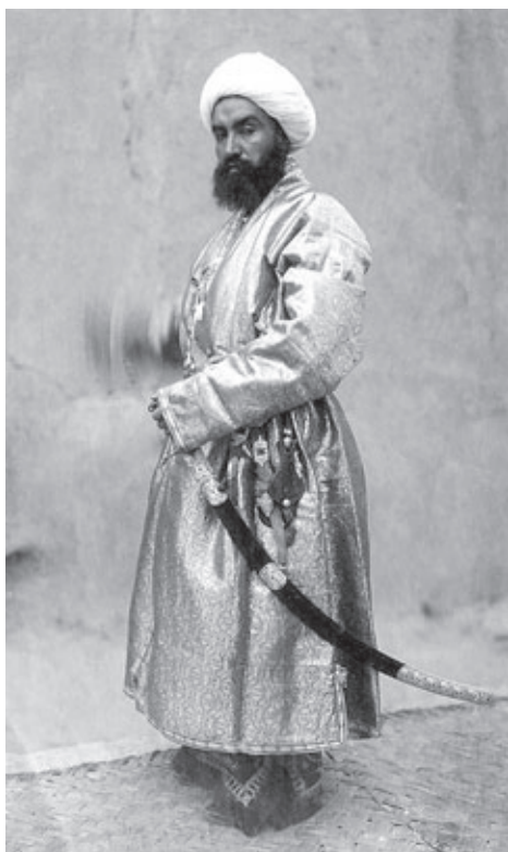
Бухарский сановник с кривой иранской саблей на поясе

Металлические детали прибора часто были украшены инкрустацией двух типов: внутренней (когда толстая латунная проволока тупо вбивалась в глубокие бороздки с зигзагообразными краями и заглаживалась потом вровень) и поверхностной (серебряная или латунная проволока набивалась на заштрихованную поверхность металла). Грузинский орнамент на саблях такого типа состоял из мелких и крупных розеток, стеблей и листьев.