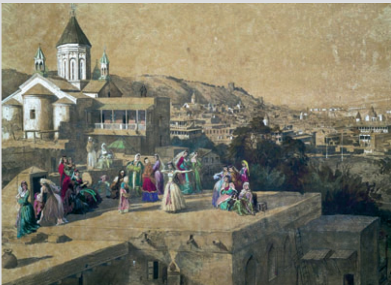
Г. Гагарин. На тифлисских кровлях