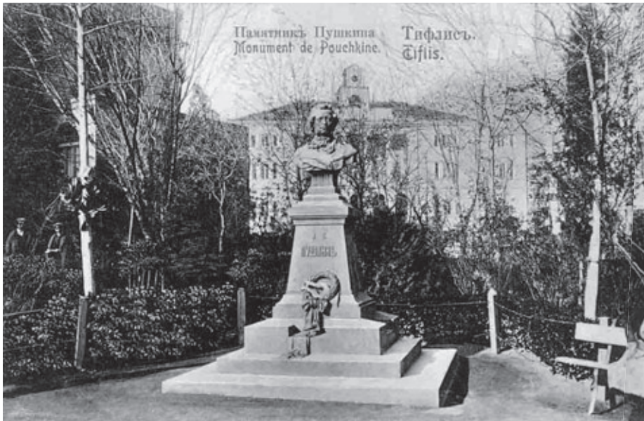
Памятник А. С. Пушкину. Тифлис