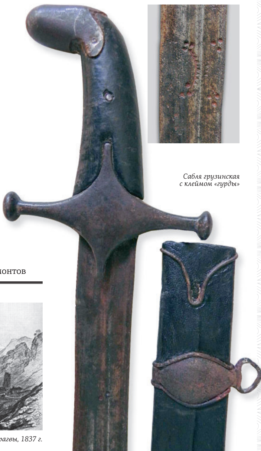
Сабля грузинская с клеймом «гурды»