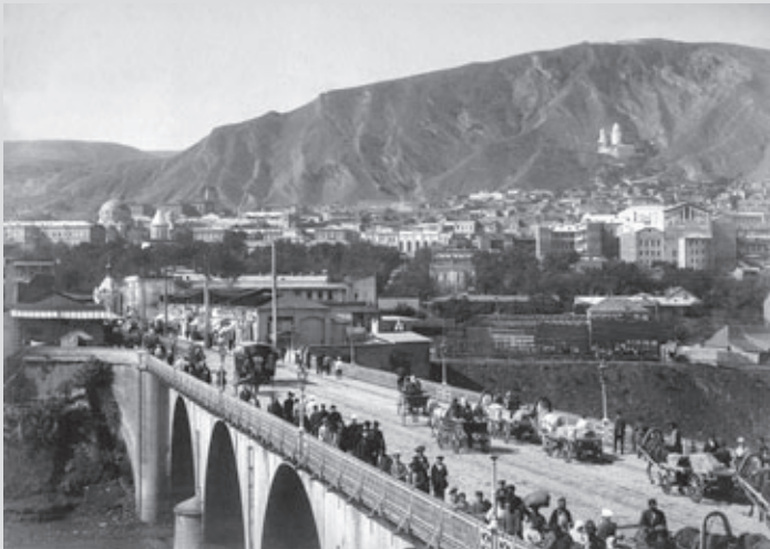
Тифлис, XIX век