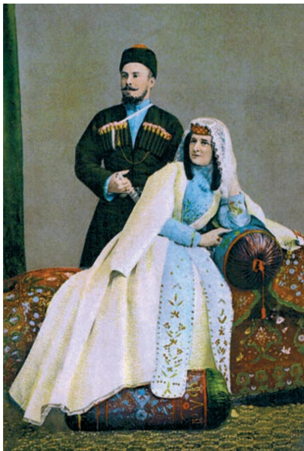
Типы Кавказа. Грузин и грузинка. Открытка