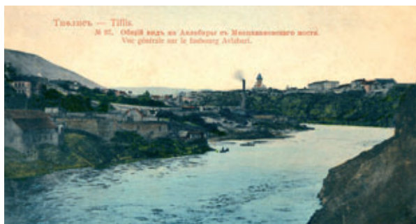
Тифлис. Общий вид на Авлабар