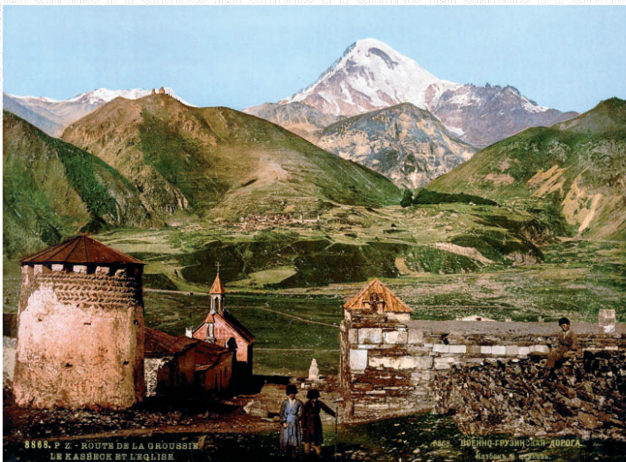
Военно-Грузинская дорога. Казбек и церковь. Открытка