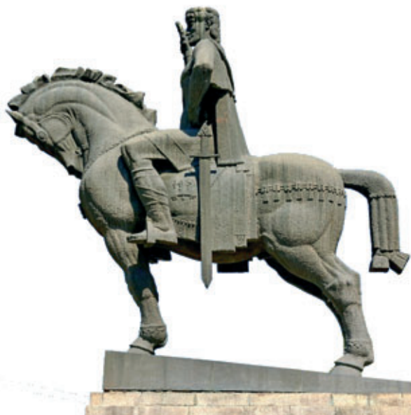
Памятник Вахтангу I Горгасали. Тбилиси

В целом считается, что в XVIII—XIX веках на территории Грузии существовало несколько типов сабель. Коснемся тех, чье наличие никто особо не подвергает сомнению.