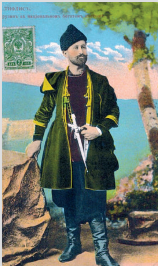
Тифлис. Грузин в национальном богатом костюме. Открытка