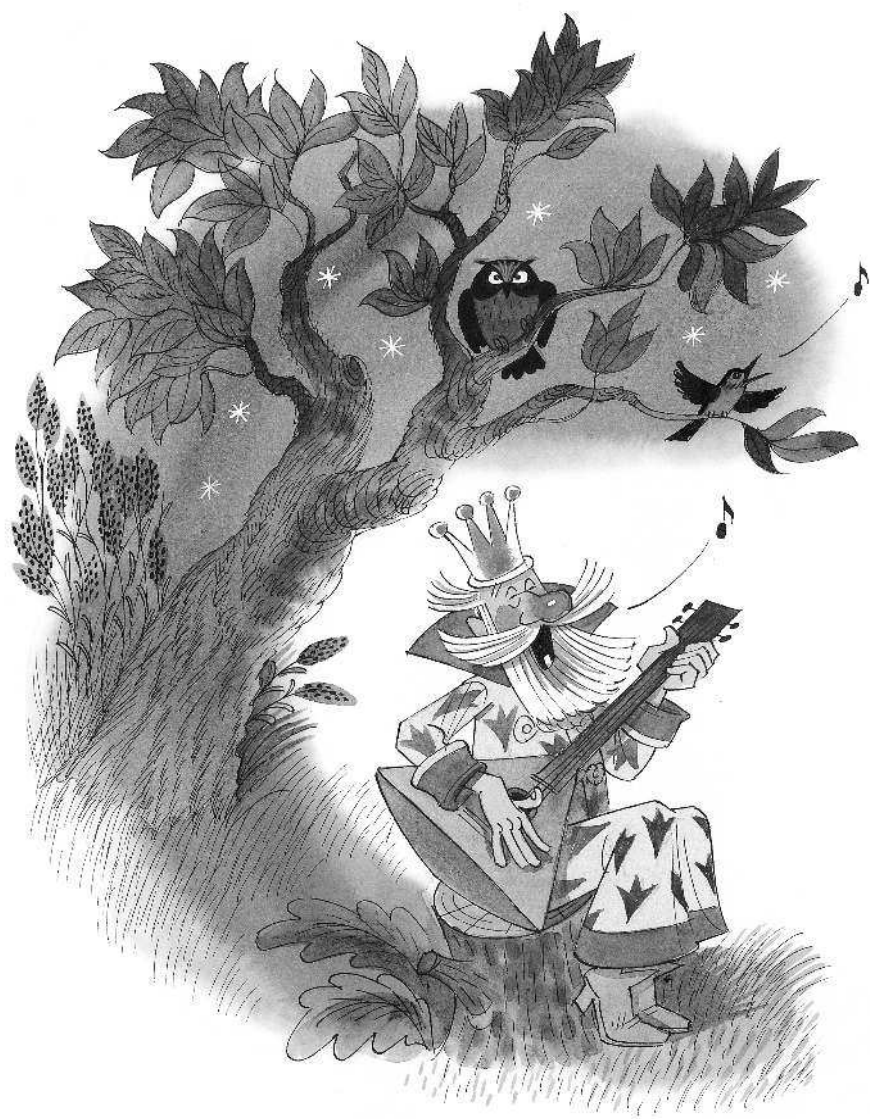
Художник Виктор Чижиков