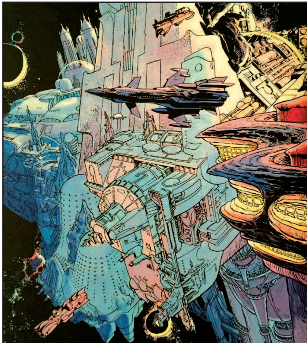
Наверху: Вид изнутри (слева) и снаружи (справа) Главного Пункта, вдохновившего на создание Альфы, из комикса «Посланник Теней». Рисунки Жан-Клода Мезьера Внизу: Группа основных инопланетян фильма (слева направо): Сиирт-полицейский и концепт-арты Сиирта Патриса Гарсии; Игон Сирасс; Игон Сирасс Джуниор, Ходар'Кхан, Мегатор и Пит-Гхор (концепт-арты Бена Мауро); Валериан в полный рост; К-Трон, Император Жемчужин Хабан-Лимай (концепт-арты Бена Мауро); Доган Дагуис, Да и мама Да (концепт-арты Патриса Гарсии); Дубликатор с Мюля (концепт-арт Жан-Клода Мезьера); Булан-Батор III, жена Булан-Батора, сын Булан-Батора, Мартапурай (концепт-арты Патриса Гарсии); Аспан (концепт-арт Бена Мауро); глава государства № 9 (концепт-арт Патриса Гарсии); Кортан Даук, Пальм-Муре (концепт-арты Бена Мауро); Посол Меркурия, Зеркальный, Арисум-Кормн, КСО2 (концепт-арты Патриса Гарсии)