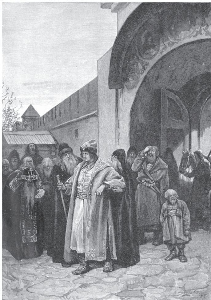
Приезд Петра в Троице-Сергиеву обитель, 8 августа 1689 г. Картина К. В. Лебедева