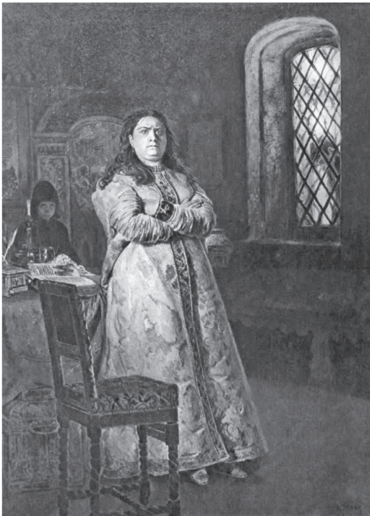
Царевна Софья Алексеевна в Новодевичьем монастыре. Картина И. Е. Репина