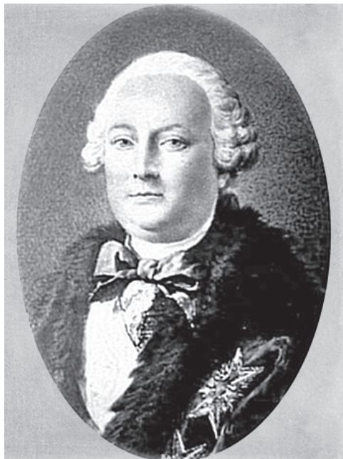
Маркиз де ла Шетарди