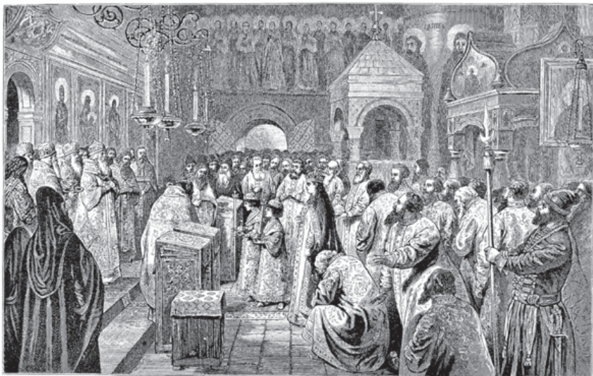
Венчание на царство царей Иоанна и Петра Алексеевичей. 25-го июня 1682 года