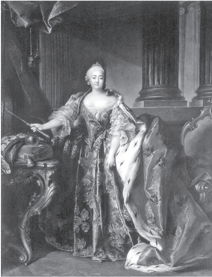
Портрет императрицы Елизаветы Петровны. Картина Л. Токке