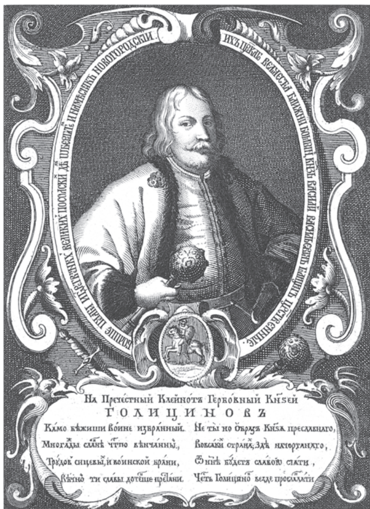
Князь Василий Васильевич Голицын. Гравюра Л. Тарасевича