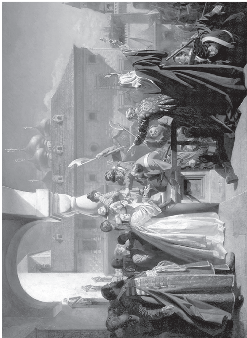
Стрелецкий бунт. Картина Н. Д. Дмитриева-Оренбургского