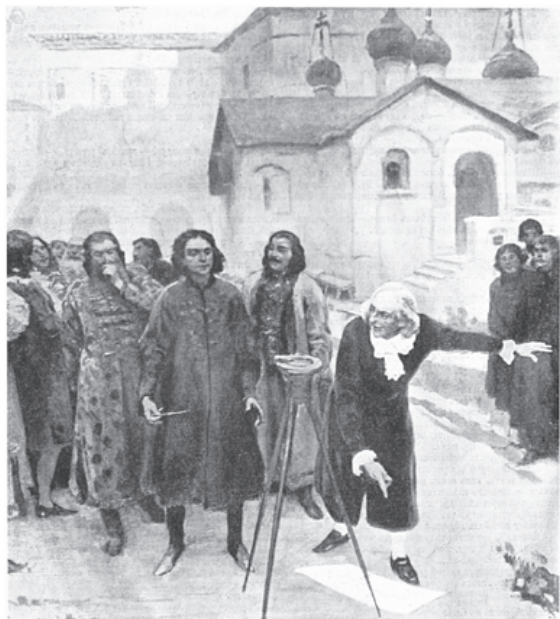
Царевич Петр (Франц Тиммерман объясняет молодому Петру употребление астрлябии, привезенной из-за границы).