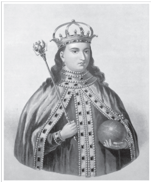
Царевна Софья Алексеевна. Литография XIX века