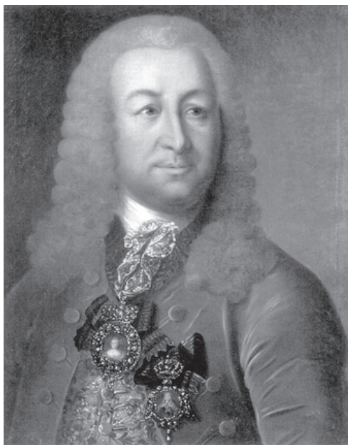
Граф Иван Иванович Лесток. Портрет работы Г. Гроота