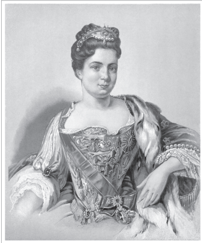
Императрица Екатерина I. Литография XIX века