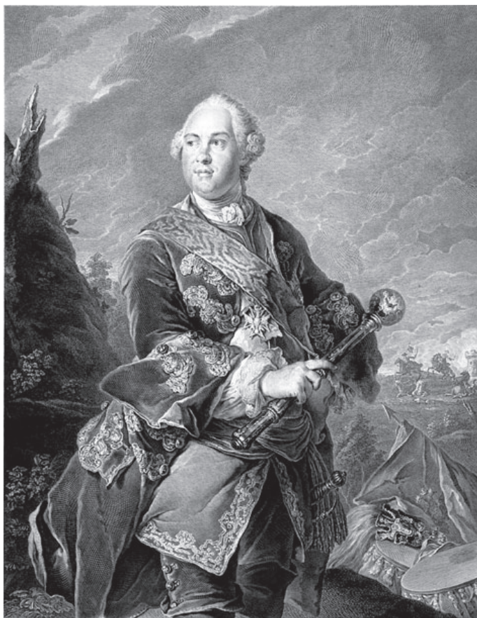
Граф Кирилл Григорьевич Разумовский. С портрета работы Токе