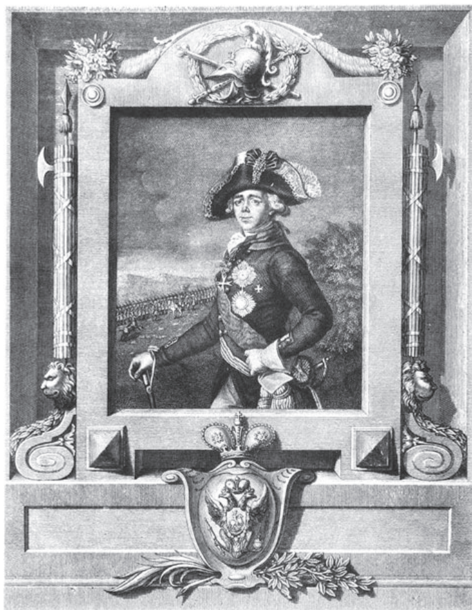
Великий князь Павел Петрович