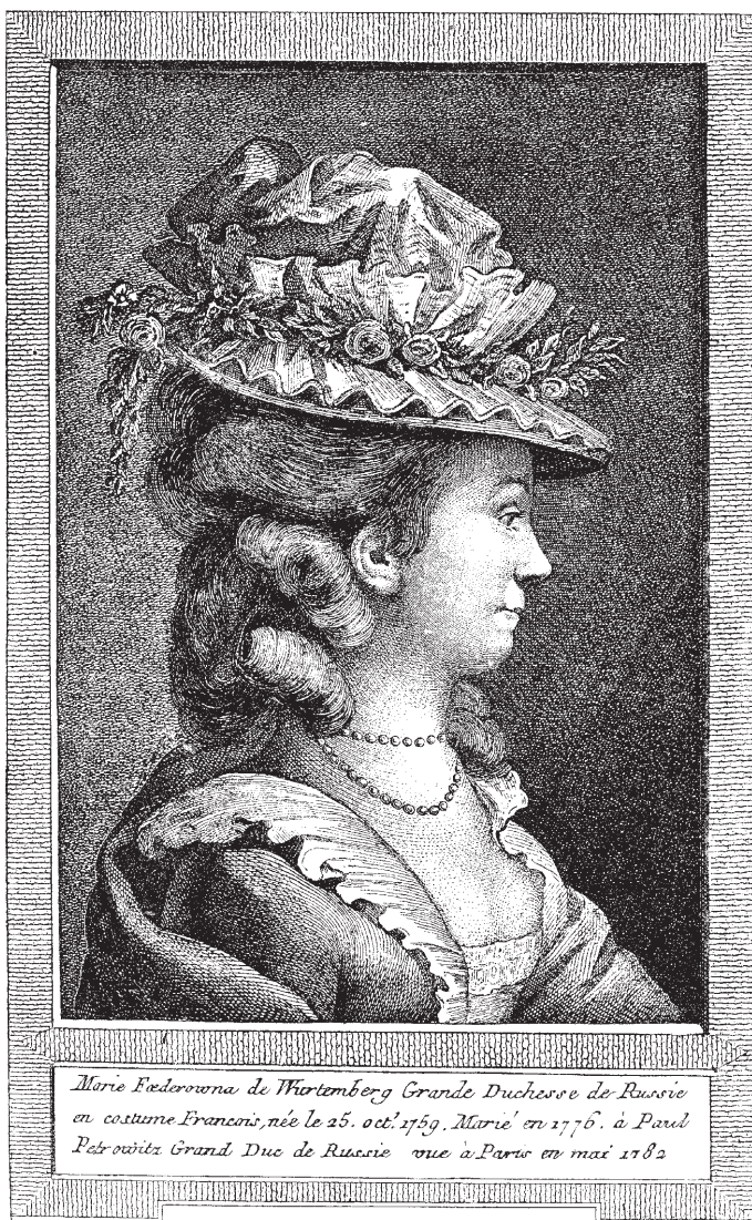
Marie Frédérovna de Wurtemberg Grande Duchesse de Russie en costume François, née le 25. oct. 1759. Mariée en 1776. à Paul Petrovitch Grand Duc de Russie vue à Paris en mai 1782