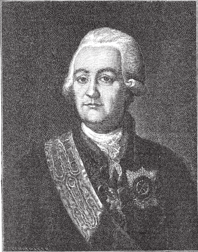
Граф П.И. Панин