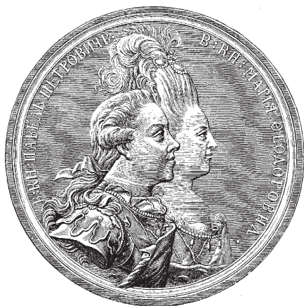
Медаль, выбитая по случаю бракосочетания Великого Князя Павла Петровича с Великой Княгиней Марией Федоровной