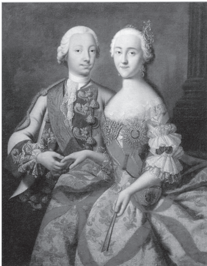
Портрет великого князя Петра Федоровича и великой княгини Екатерины Алексеевны. Г.Х. Гроот