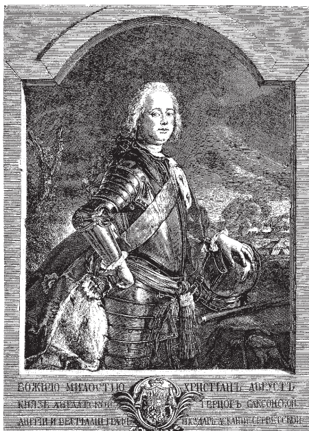
Христиан-Август, князь Ангальт-Цербстский, герцог Саксонский, отец русской императрицы Екатерины II