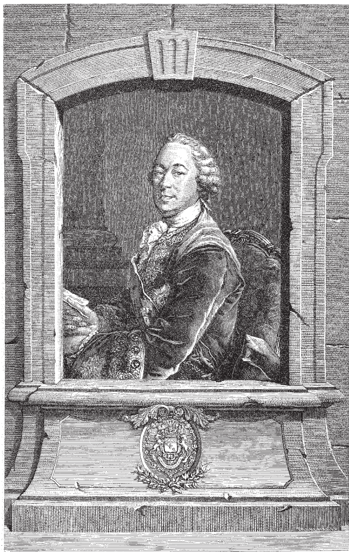
Граф Михаил Илларионович Воронцов. С портрета Токе