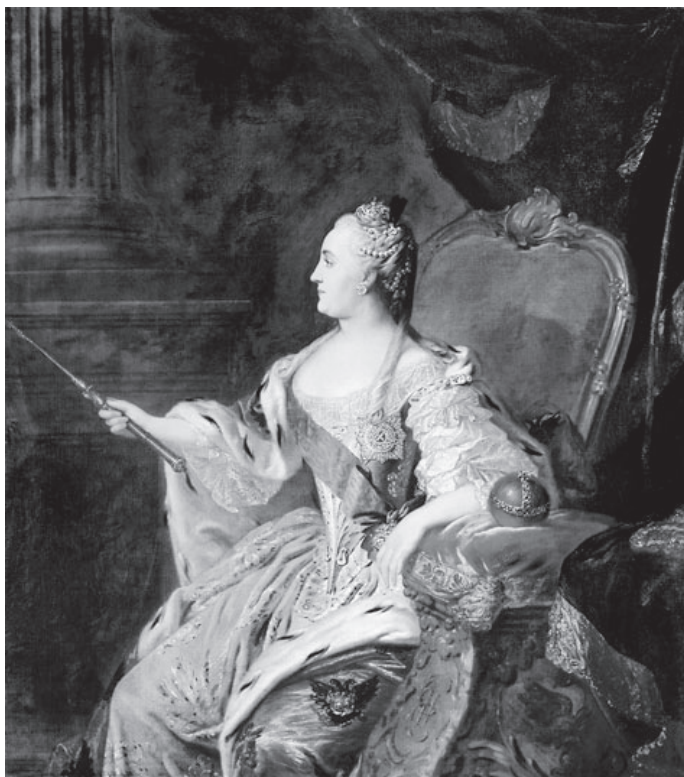
Портрет Екатерины II. Художник Ф. С. Рокотов