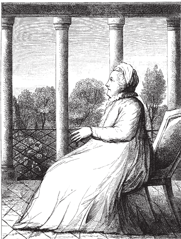
Екатерина II в домашнем платье