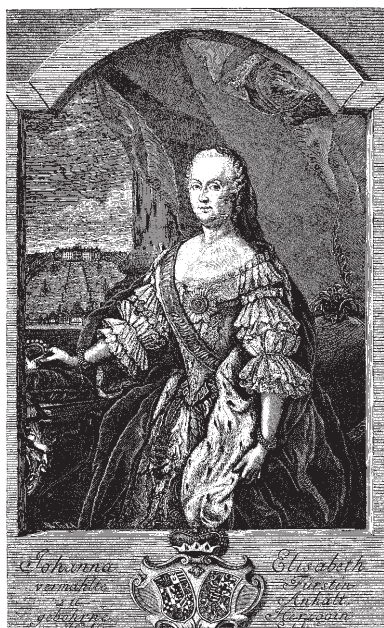
Иоганна-Елизавета, княгиня Ангальт-Цербстская, мать русской императрицы Екатерины II. С портрета работы И.М. Бернигерота