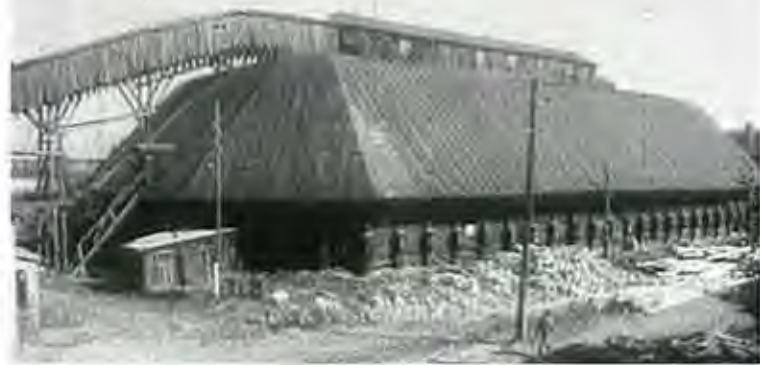
Найбільше дерев'яне вертольотце в світі "Мастодонт"