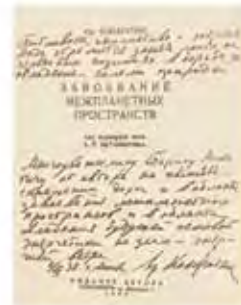
Титульна сторінка книги "Законоваві міжпланетних просторів"