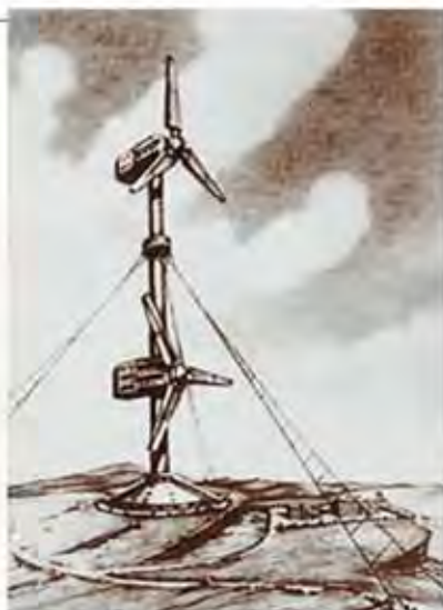
Остаточний варіант проекту КриВЕС (рисунок М. В. Нікітіна)