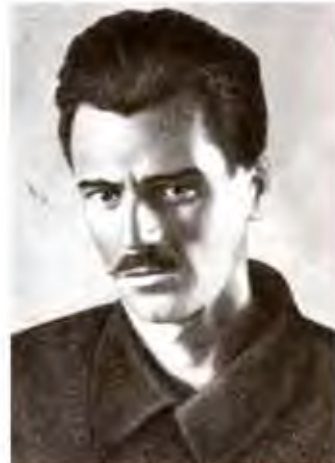
Ю. В. Кондратюк. Фото, подароване К. Е. Ціolkовському