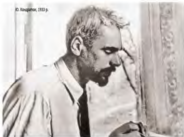
Ю. Кондратюк, 1933 р.

Мною були «винайдені»: водяна турбіна типу колеса Пельтона, замість млинових водяних коліс, які я вважав єдиними двигунами; гусеничний автомобіль для їзди по м'яких і силучих ґрунтах; безпружинні відцентрові ресори; автомобіль для їзди по нерівній місцевості; вакуум-насос особливої конструкції; барометр; годинник з довгочасним заводом, електрична машина змінного струму високої потужності; парортутна турбіна і багато інших речей, частково технічно абсолютно непрактичних, іноді вже відомих, іноді нових, заслуговуючих подальшої розробки і втілення.